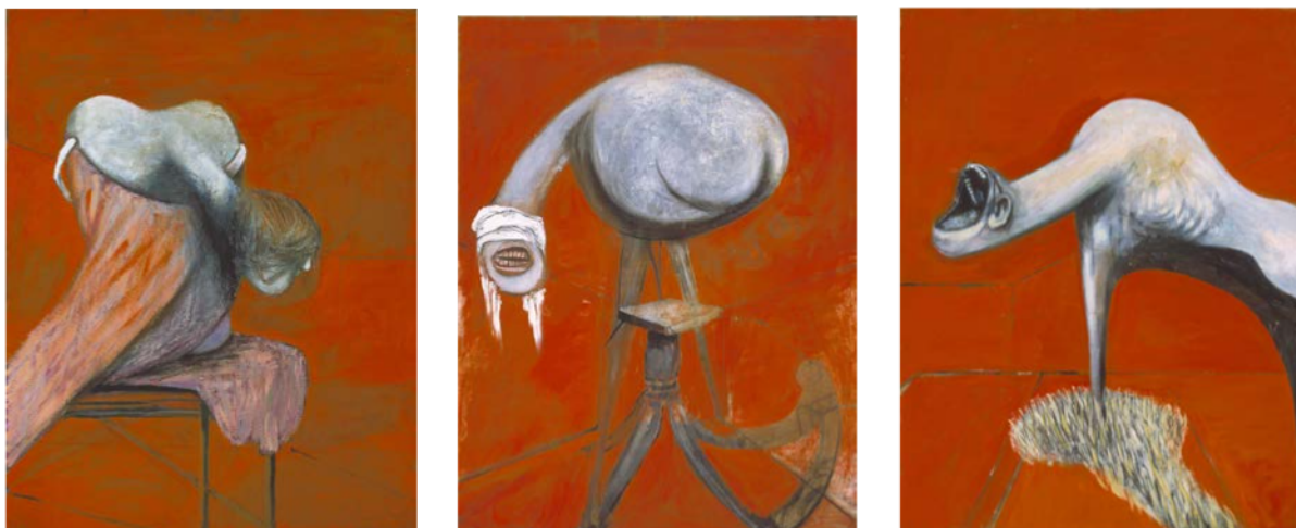
Francis Bacon. Three Studies for Figures at the Base of a Crucifixion («Tres estudis per a figures al peu d'una crucifixió») (1944). Oli i pastel sobre taula, 94 × 74 cm. Tate Britain, Londres.

Observeu les imatges següents. Fixeu-vos també en l'any i el títol.