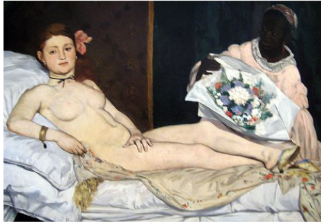
Édouard Manet. Olympia (1863). Oli sobre tela, 130,5 × 191 cm. Museu d'Orsay, París.

Observeu atentament les imatges següents.